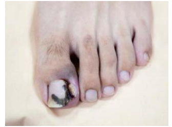
內側甲溝因嵌甲造成紅腫與肉芽組織